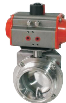
QW8102-50BK II c-QAS63