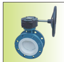
DF810-125CF [III] a-F4W