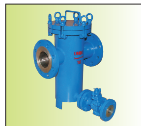
KTLG-80CF-[20]-□" (排污口带排污球阀)