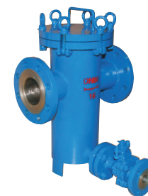
KTLG-80CF-[20]-□ (排污口带排污球阀)