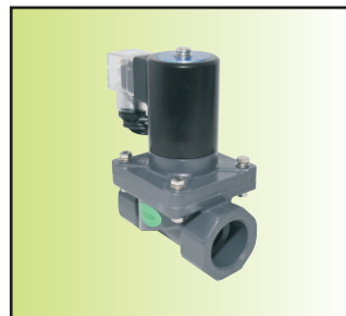
Z3CF-25UZI d02-D (粘插连接)