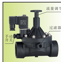
Z199-32 \bar{A} Ib02 (DN32~50常闭型)