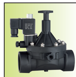
Z196-40 \bar{A} Ib02 (DN32~50常开型)