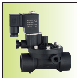
Z199-15 \bar{A} Ib02 (DN15~25常闭型)