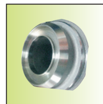
防火型内部防火槽