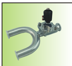
QW GK311-25LA-U 3