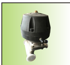
QW GK311-25Ea1-T 3