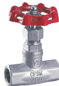
MJ11W-15R (美标) (公称压力为200PSI)

在线销售QQ: 2880686076 2880686079 2880686085 2880686090 2880686098