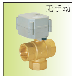
C53032*3-20TIIg04-& C53031*3-25TIIg02- T